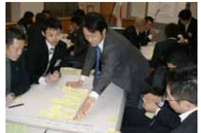
グループ討議の様子